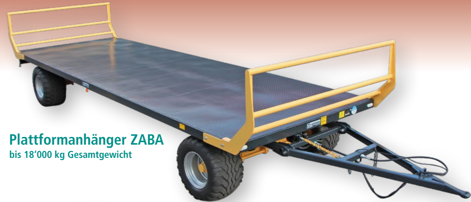
Plattformanhänger ZABA bis 18'000 kg Gesamtgewicht