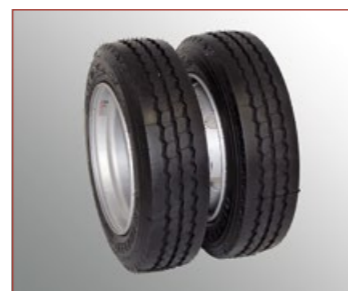
Zwillingbereifung 205/65R17.5", Pneubreite 215mm, Durchmesser 710mm