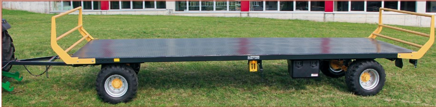
Plattformanhänger ZABA und TABA bis 24'000kg Gesamtgewicht