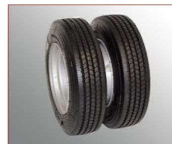
Zwillingbereifung 215/75R17.5", Pneubreite 220mm, Durchmesser 780mm