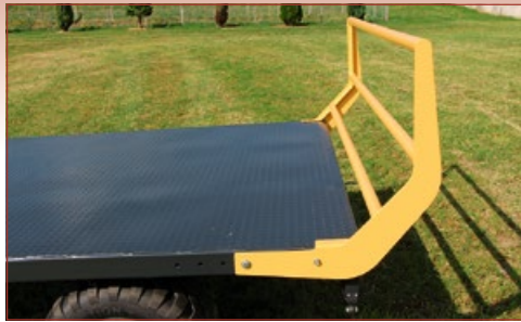
Rundballengestütz, klappbar, verstellbar