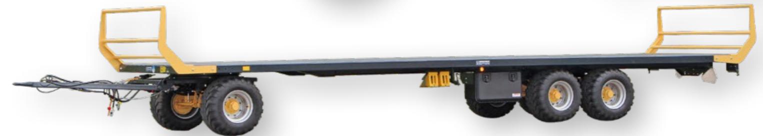
Plattformanhänger TABA bis 24'000 kg Gesamtgewicht

Die Plattformanhänger sind auf höchstem Niveau verarbeitet, echt SWISS MADE!