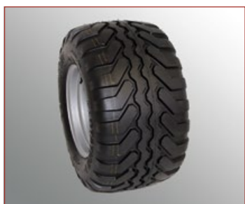
Vredestein Flotation+ 480/45-17", Breite 480mm, Durchmesser 850mm