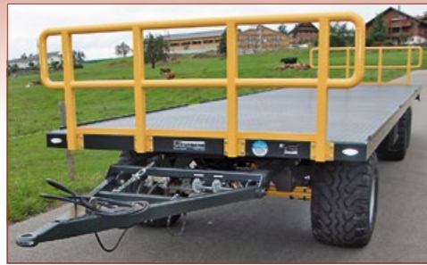
Abschlussgatter gesteckt oder geschraubt