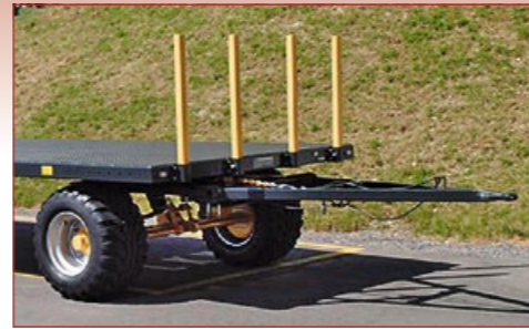
Rungen gesteckt 85cm, auf Wunsch mit Einsteckverlängerungen bis 240cm