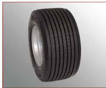
445/45R19.5", Breite 460mm, Durchmesser 910mm