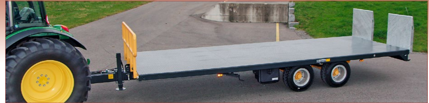
Plattformanhänger ZATA mit kippbarer Brücke bis 20'000kg Gesamtgewicht