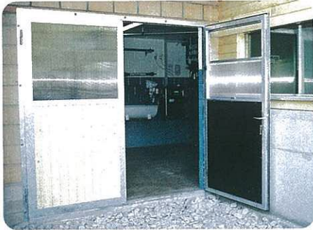
Stahltüre 2-flügelig, Alu-Fenster Verolux